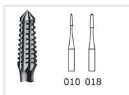
Fissurenfräser mit Querhieb

Je 2 Stück 0,9 – 1,4 und 2,3 mm. Zum Arbeiten an Nägeln. Für die Behandlung von Hühneraugen.