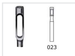
Langloch und Hohlfräser

1 Stück 2,3 mm. Zur Behandlung von Hühneraugen und Hornhaut.