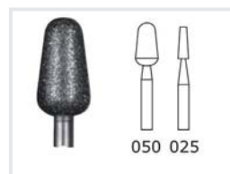
Schleifkörper Edelkorund (rosa)

1 Stück 2,3 mm. Zur Behandlung von Hühneraugen und Hornhaut.