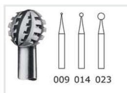
Bohrer mit Querhieb

Je 2 Stück 0,7 – 1,6 und 2,9 mm. Zum Arbeiten an Nägeln. Für die Behandlung von Hühneraugen.