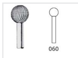
Fräser mit Querhieb