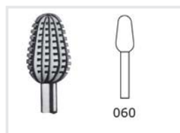
Fräser mit Querhieb