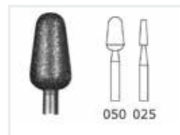
Schleifkörper Edelkorund (rosa)

1 Stück 2,3 mm. Zur Behandlung von Hühneraugen und Hornhaut.