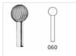
Fräser mit Querhieb