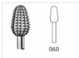
Fräser mit Querhieb