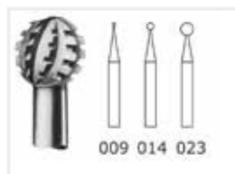
Bohrer mit Querhieb

Je 2 Stück 0,7 – 1,6 und 2,9 mm. Zum Arbeiten an Nägeln. Für die Behandlung von Hühneraugen.