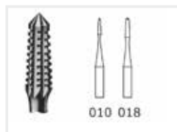
Fissurenfräser mit Querhieb

Je 2 Stück 0,9 – 1,4 und 2,3 mm. Zum Arbeiten an Nägeln. Für die Behandlung von Hühneraugen.