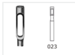
Langloch und Hohlfräser

1 Stück 2,3 mm. Zur Behandlung von Hühneraugen und Hornhaut.